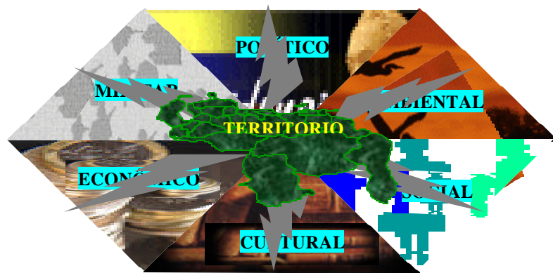
Gráfico N° 1 Ámbitos del Orden Interno

De acuerdo con Cova Rangel, O. (2000), el término orden interno puede ser interpretado desde el punto de vista filosófico; y en ese estadio, presenta una significación estructural que se basa en la génesis misma del Estado y en la forma como éste se organiza para existir sobre la base de un ordenamiento de los diversos entes o poderes necesarios para atender sus necesidades. En el marco de ese ordenamiento emergen dos (2) dimensiones del orden interno: una funcional y otra aplicativa. La dimensión funcional es la forma como ha sido fundado el orden interno en la norma y su utilidad para satisfacer las necesidades y realidades concernientes a los diferentes ámbitos que le corresponden (ver gráfico N° 1); mientras que la dimensión aplicativa se refiere al espacio subjetivo de la norma que establece el aparato institucional, órganos o instancias del Estado que administran la norma, adquiriendo importancia la gestión de los actores para mantener el orden interno (Ruiz, J. 1999).